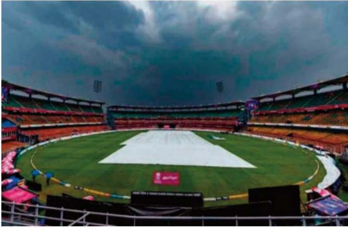
విజయానికి ఇంకా 275 పరుగులు అవసరం.