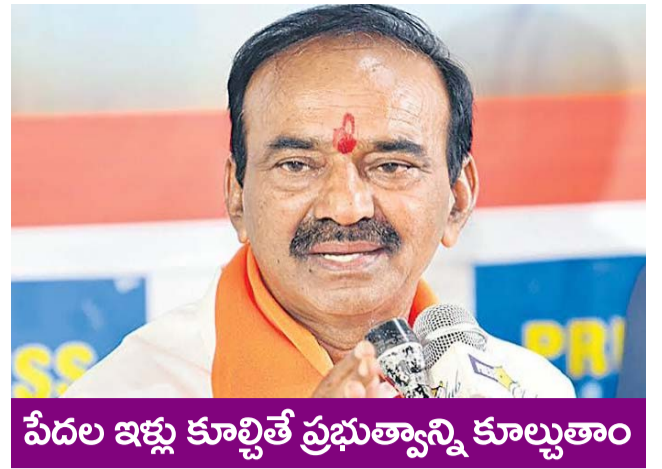
పేదల ఇళ్లు కూల్చితే ప్రభుత్వాన్ని కూల్చుతాం

PUBLISHED FROM HYDERABAD CIRCULATED BY RANGAREDDY, NALGONDA, KHAMMAM, KARIMNAGAR, WARANGAL, MAHABOONAGAR, MEDAK, NIZAMABAD, ADILABAD